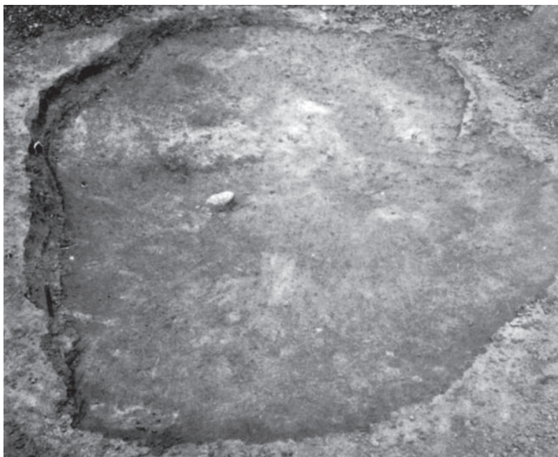
Domorodačka koliba na nalazištu „Dumbovo“ kod Beočina Native hut at the site “Dumbovo” at Beočin

keramika karakteristični su za IV vek. Spekula, kvadratne osnove, građena od pritesanog i lomljenog kamena, služila je za zaštitu stanovništva vile i za sprečavanje prolaza neprijatelja kroz dolinu u unutrašnjost provincije. Arheološka istraživanja obavljena su od 1972. do 1974.